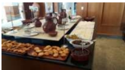
Constantinos the Great